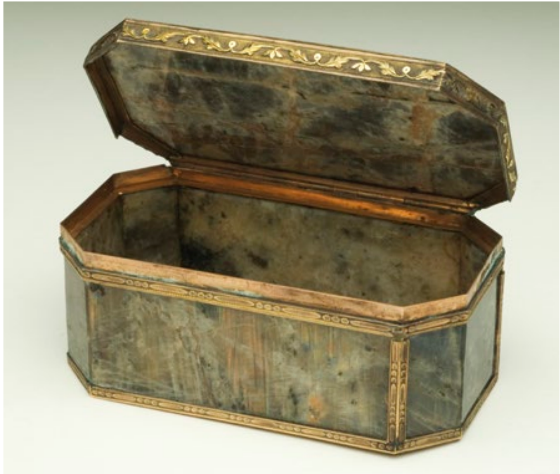
Fig. 4 Tabacchiera in labradorite con cerniera e guarnizioni in oro. È stata donata dal Granduca al Museo il 1 luglio 1794. Manifattura fiorentina (Galleria dei Lavori), fine XVIII sec. Misure: 8 x 5 x 3 cm. Inv. 13681