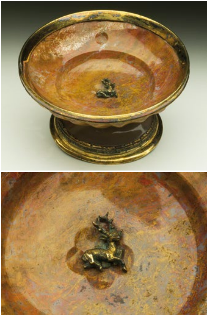
Fig. 2 Coppa in diaspro, col piede in agata e montatura in argento dorato; al centro, sul fondo un piccolo cervo. Di manifattura ignota (XV sec.), proviene dagli Uffizi ed è citata nell'inventario di Galleria del 1704. Misure: diametro 11 cm; altezza 6 cm. Inv. 13503.

Fig. 2 Jasper cup with agate pedestal and gilded silver mount: centre, a small deer on the bottom. Of unknown manufacture (16 th century), it comes from the Uffizi Gallery and is mentioned in the 1704 inventory. Measurements: diameter 11 cm, height 6 cm. Inv. 13503.