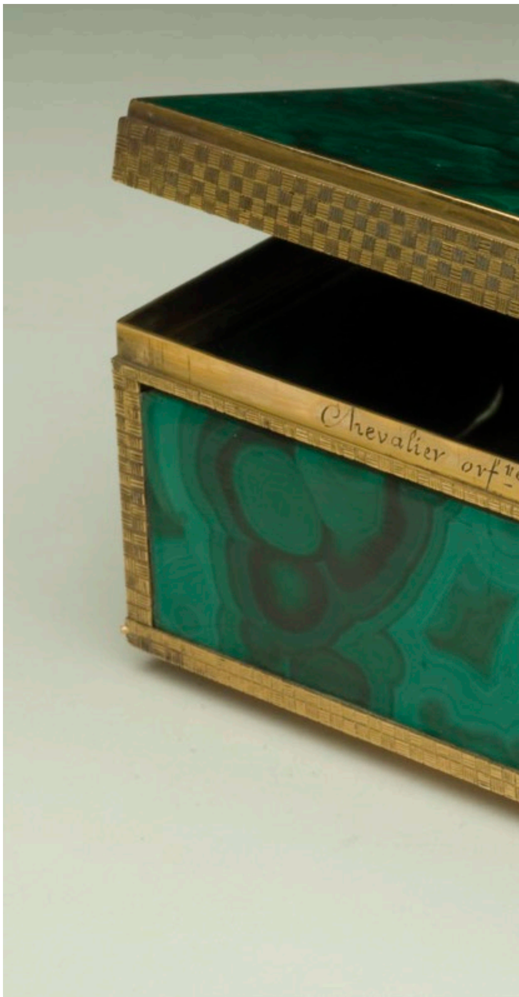
Fig. 14 Tabacchiera in malachite con cerniera in oro, firmata «Chevalier orf.vre du Roy Madrid». Misure: 5 x 7 x 5 cm. Inv. 13530.

Only a very small part of the specimens of this collection has been subjected to mineralogical analysis, in particular some lapis lazuli and jade objects. The most sensational result was the discovery that a snuffbox and a box described as jade in the ancient catalogues are in fact glass.