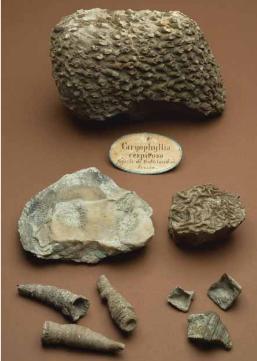
Fig. 5.8 Gruppo di coralli del Siluriano dell'isola di Gotland, nel Mar Baltico, acquisiti dal museo in epoche diverse. Il tetracorallo coloniale Caryophyllia cespitosa , appartenne con ogni probabilità al museo di Targioni. Al centro a sinistra un secondo tetracorallo coloniale con individui di grosse dimensioni, Ptychophyllum patellatum , a destra il tabulato Halysites catenulatus . Sotto due specie di tetracoralli solitari dai nomi evocatori della loro forma, Cystophyllum cylindricum e Goniophyllum pyramidale .

Fig. 5.8 Group of Silurian corals from the island of Gotland, Baltic Sea, acquired by the museum in different epochs. The colonial tetracoral Caryophyllia cespitosa , in all probability belonged to the Targioni Museum. In the centre, to the left, another colonial tetracoral with specimens of large dimensions, Ptychophyllum patellatum ; on the right the tabulate Halysites catenulatus . Below, two species of solitary corals, Cystophyllum cylindricum and Goniophyllum pyramidale whose names are reminiscent of their form.