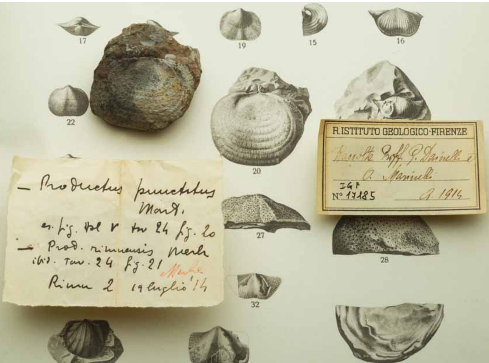
Fig. 5.14 Olotipo di Productus punctatus Merla 1934, esemplare raccolto da Dainelli e Marinelli nel luglio 1914 presso il campo di Rimu, durante la spedizione De Filippi in Himalaya.

Fig. 5.14 Holotype of Productus punctatus Merla 1934, specimen collected by Dainelli and Marinelli, July 1914, near the Rimu campsite, during the De Filippi expedition to the Himalayas.