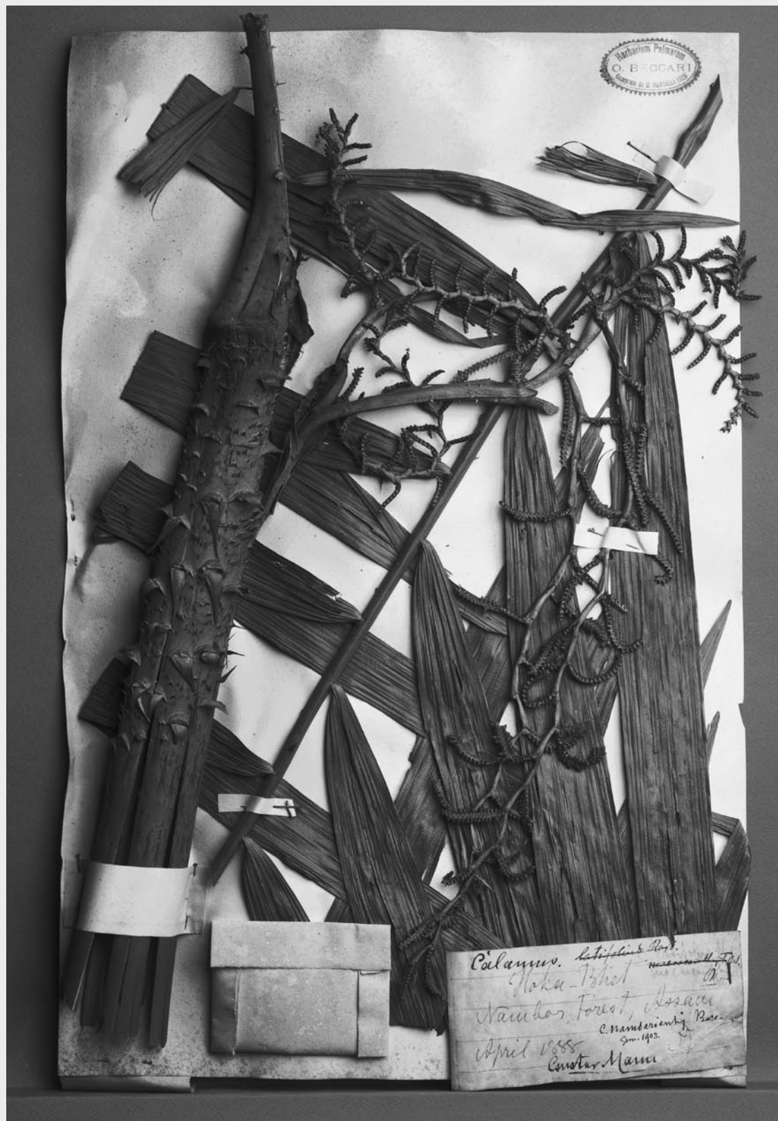
Fig. 15 Campione di Palma raccolto in Assam da G. Mann e inviato a O. Beccari.